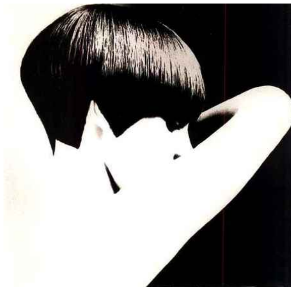
David Montgomery, Grace Coddington Five Point Cut by Vidal Sassoon, 1964, tirage argentique.