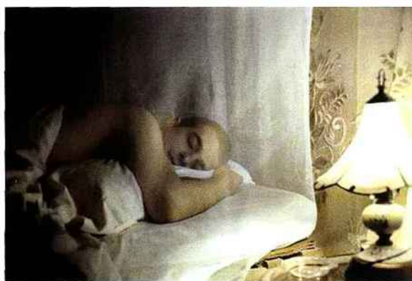
Youssef Nabil, Hope to die in my sleep, selfportrait Vinales, 2005 ; Selfportrait with the sunset, Rio de Janeiro , 2005 (©Youssef Nabil).